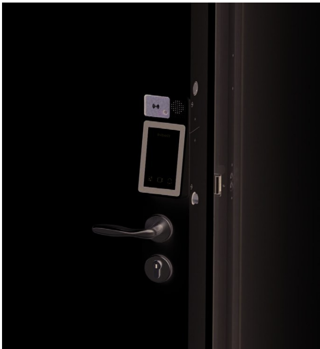
Écran tactile 5" et sonnette caméra grand angle